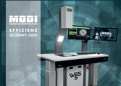
WES V5 - Wareneingangssystem